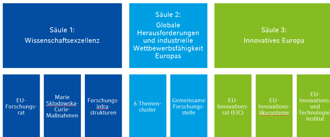
Abb. 2: Struktur des Programms „Horizon Europe“ (eigene Darstellung)