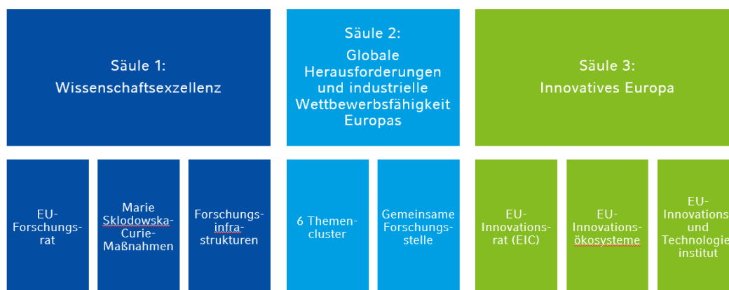
Abb. 2: Struktur des Programms Horizont Europa

Die Förderung erfolgt hauptsächlich in Form von Zuschüssen. Die Antragstellung läuft vor allem über das Funding & Tenders-Portal der EU-Kommission. Dort werden regelmäßig Ausschreibungen veröffentlicht, die unterschiedliche thematische Schwerpunkte der Förderung beinhalten. Insgesamt liegt ein besonderer Fokus auf der Unterstützung von Projekten aus den Bereichen Digitalisierung, Klimaschutz und Nachhaltigkeit.