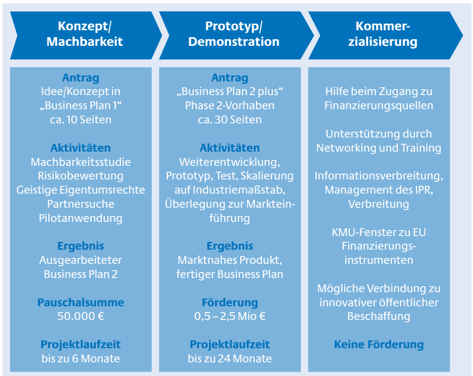
Abb. 2: Die drei Phasen des KMU Investments

Es besteht die Möglichkeit zu Verbund- oder Einzelförderung. Antragsberechtigt sind ausschließlich gewinnorientierte KMU.